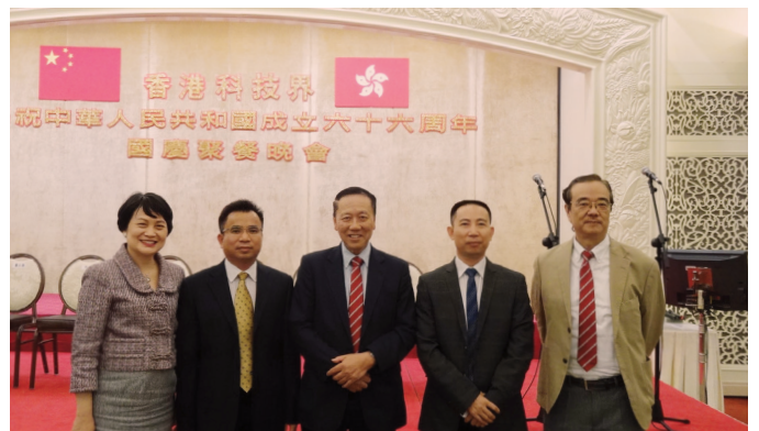
▲ 生產力促進局總裁麥鄧碧儀女士及廣東省科協代表合照留念