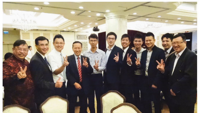
▲ 何博士與年青工程師打成一片，氣氛融洽